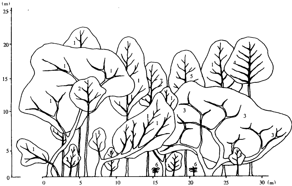
图 1 东京枫杨群落垂直结构图 Fig. 1 The profile diagram of Pterocarya tonkinensis community

1. 东京枫杨 Pterocarya tonkinensis 2. 山核心 Albizia odoratissima 3. 五桠果 Dillenia indica 4. 团花 Anthocephalus chinensis 5. 滑桃树 Trewia nudiflora 6. 露兜 Pandanus furcatus 7. 糖胶树 Alstonia scholaris 8. 毛紫薇 Lagestroemia tomentosa